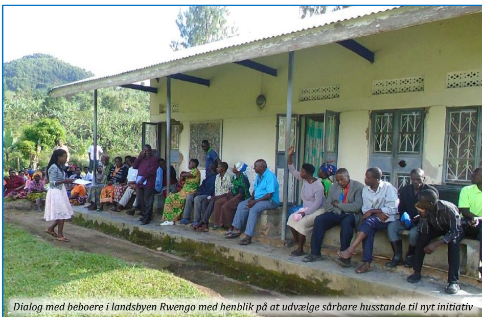
Dialog med beboere i landsbyen Rwengo med henblik på at udvælge sårbare husstande til nyt initiativ