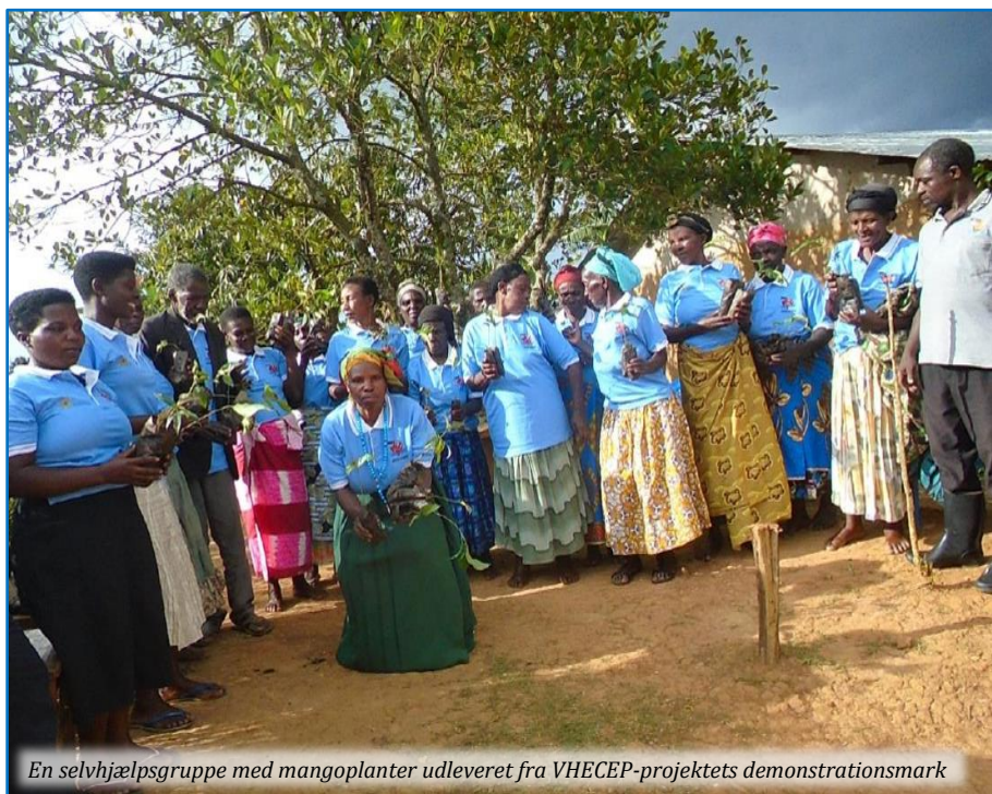
En selvhjælpsgruppe med mangoplanter udleveret fra VHECEP-projektets demonstrationsmark