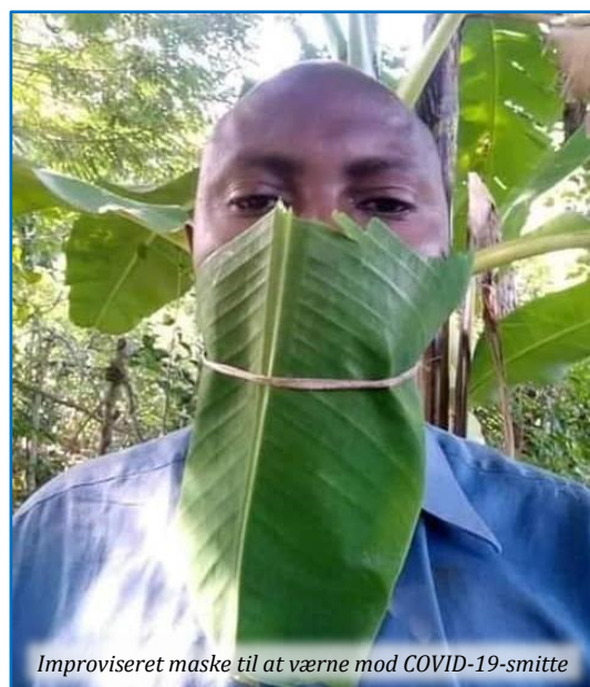
Improviseret maske til at værne mod COVID-19-smitte

Som medlem af foreningen modtager du tre årlige nyhedsbreve. Find meget mere information om foreningen og hold dig opdateret om dens aktiviteter på: