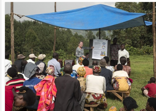
Formidling af menneskerettigheder og lighedsprincipper i landsbyen Kifunjo