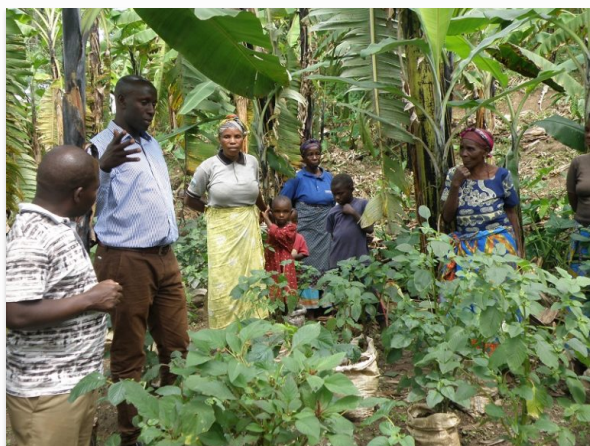
Fælleshave med planter af grøntsagen amarant (dodo) hos selvhjælpgruppen i Burandami

Støtteforeningen til selvhjælp i Uganda fik i december 2017 tilsagn om en bevilling på 399.999 kr. fra Civilsamfundspuljen til projektet " Vulnerable Households Empowerment and Civic Engagement Promotion Project Kanungu ", j.nr. 17-2126-MI-okt, kort kaldet VHECEP-projektet . Projektets totalbudget var 414.719 kr. Det løb fra den 1. januar 2018 til den 31. december 2019 og blev udført i samarbejde med partnerorganisationen Mend the Broken Hearts Uganda (MBHU), som stod for hovedparten af den faglige indsats. Støtteforeningens rolle foruden tilsyn og administration var at formidle menneskerettigheder og lighedsprincipper samt at bidrage med input til forbedrede dyrkningsmetoder. Projektet byggede videre på de gode resultater og erfaringer opnået i Orphans and Other Vulnerable Children's Households Development Project Kanungu , der kørte i 2016 og 2017. I forhold til dette projekt blev sårbare husstande og øvrig befolkning i otte nye landsbyer inddraget, ligesom juridisk rådgivning, vold mod kvinder og børn og forbedret landbrug var medtaget som aspekter med særlig fokus.