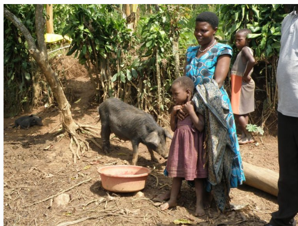
Forsørger og hendes barn i Kanyantama med deres svin, der har fået smågrise